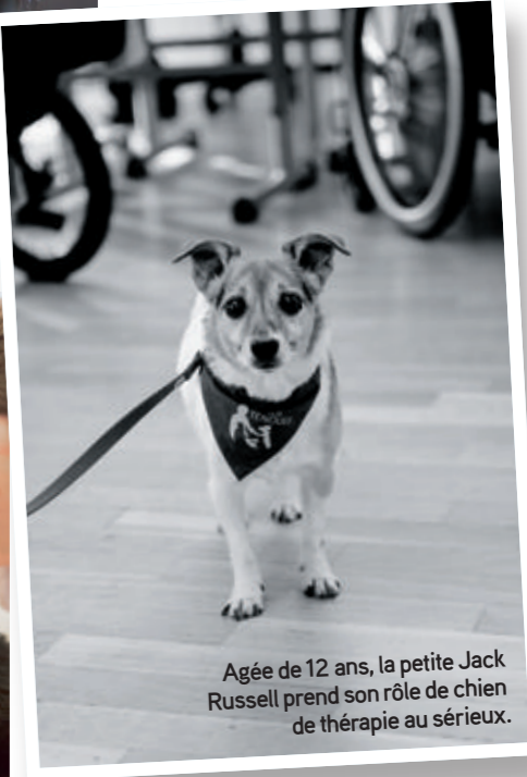
Agée de 12 ans, la petite Jack Russell prend son rôle de chien de thérapie au sérieux.